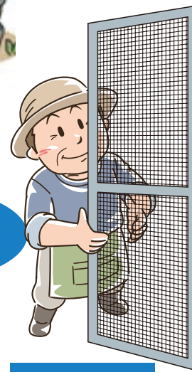
襖・障子・網戸 の張替え