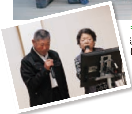
「恵の湯神の郷温泉にて、 温泉、宴会、カラオケと楽 しました。」