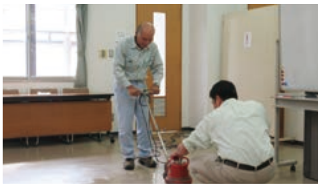
10 月 公共施設清掃講習会