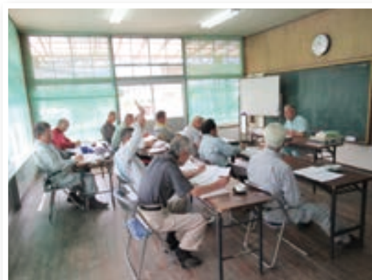
8 月 剪定講習会