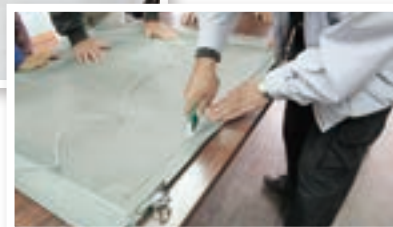
11 月 障子・網戸張替講習会

今後も講習会を計画中です。また随時お知らせしていきますので、興味のある方はぜひお問い合わせでご参加下さい。