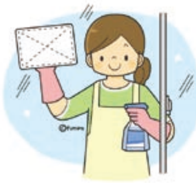
清掃及び ゴミ処分