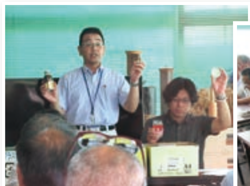
7 月 ゴミ処分講習会